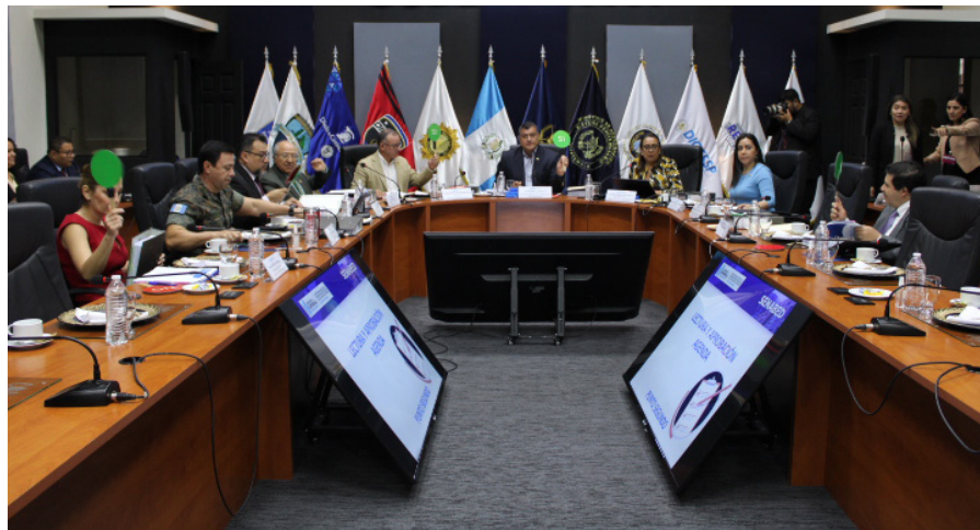
Sesión del Consejo Nacional de Administración de Bienes en Extinción de Dominio